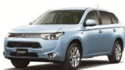
三菱 アウトランダーPHEV