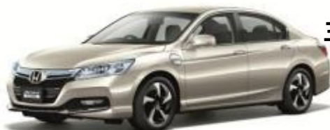
ホンダ アコード PHEV