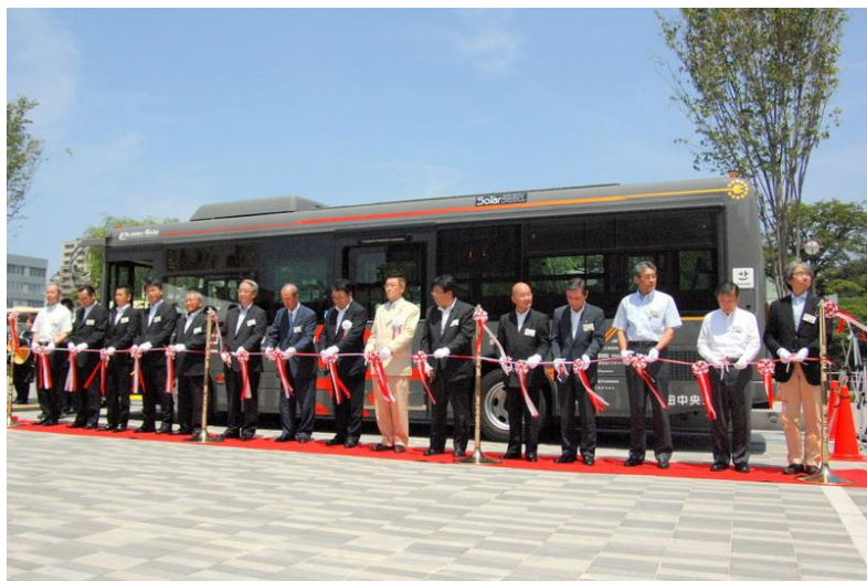
H24年7月21日、秋田市中心市街地 「なかいち」でお披露目